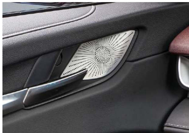
4 высокочастотных динамика, 4 низкочастотных динамика