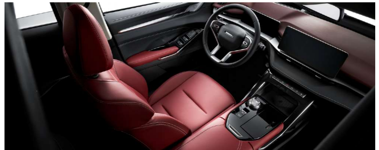
Подогрев и вентиляция передних сидений