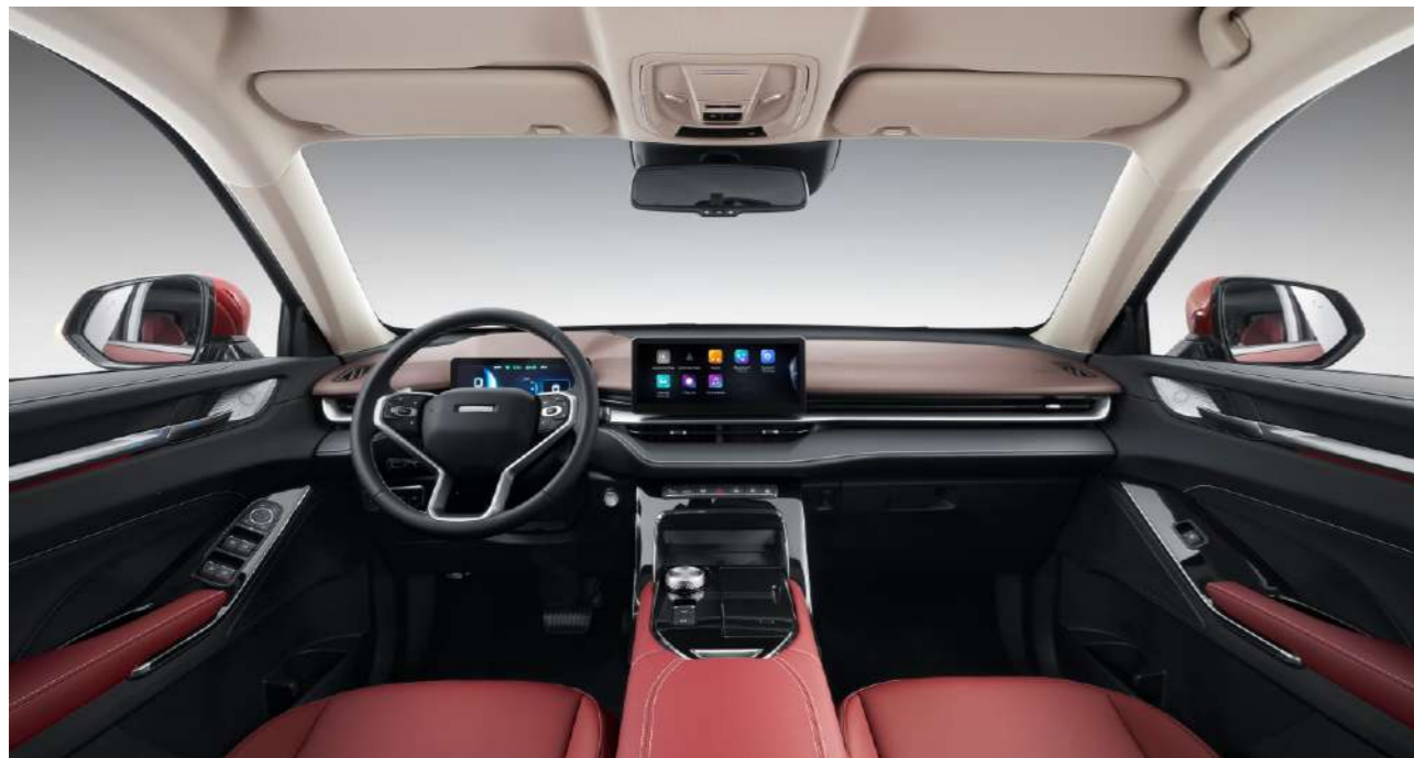
Комфортный и интуитивный дизайн салона