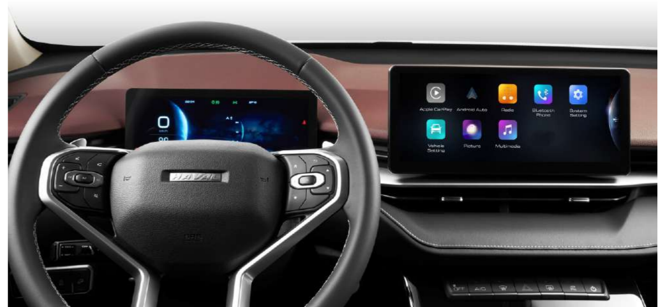
12,3-дюймовый сенсорный экран Поддержка Apple CarPlay и Android Auto