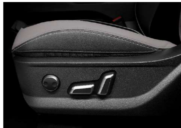
Электрорегулировка передних сидений